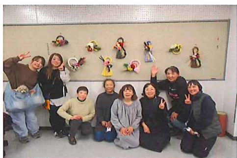
(奈義地区) しめ縄リース作成講座