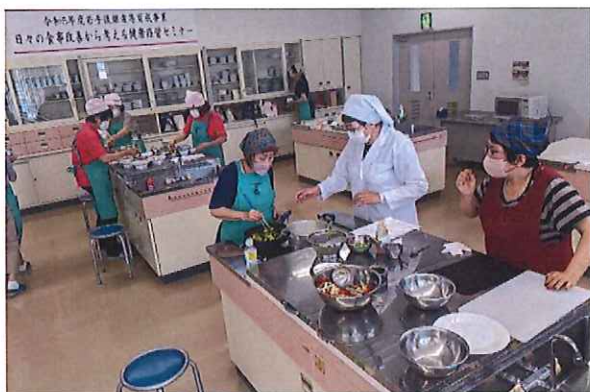
若手後継者等育成事業 講習会の様子