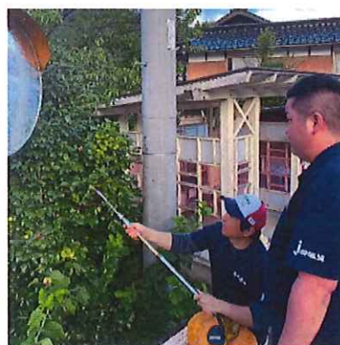
カーブミラー清掃ボランティア活動