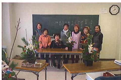
(勝北地区) フラワーアレンジメント教室