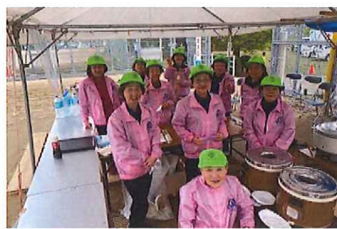
(加茂地区) 津山加茂郷フルマラソン全国大会 カレーライス販売