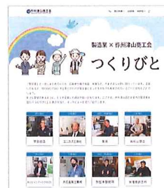
つくりびと TOP ページ