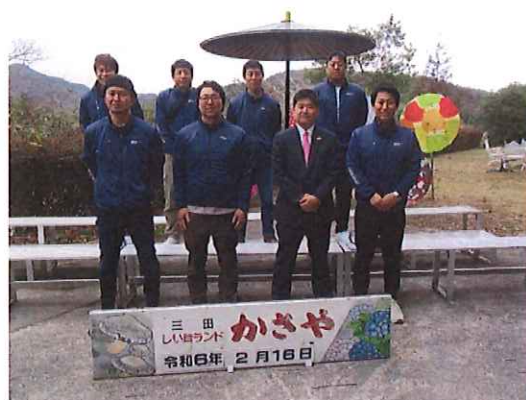
兵庫県三田市への視察研修会