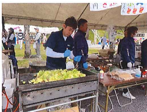
道の駅久米の里仙人まつりへの出店