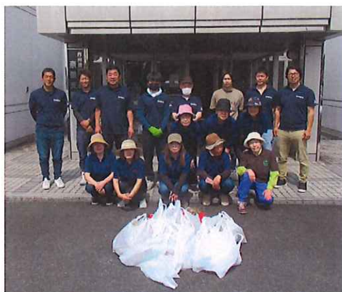
“絆”感謝運動 女性部と共同実施