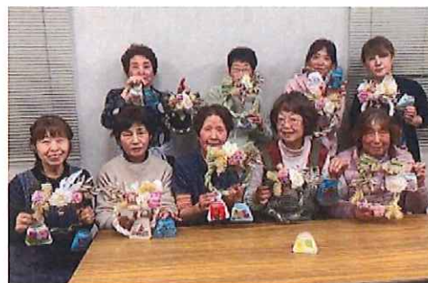
(久米地区) 教養講座