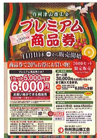
プレミアム商品券ポスター