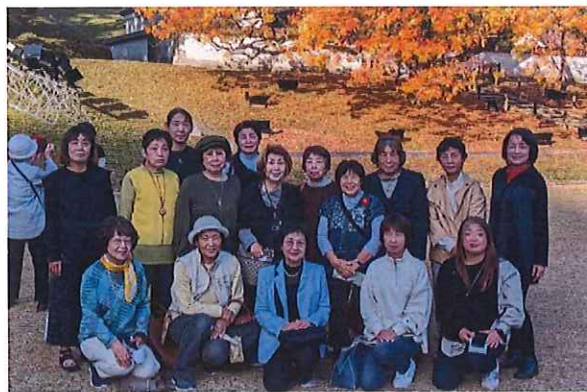
備前市方面への視察研修