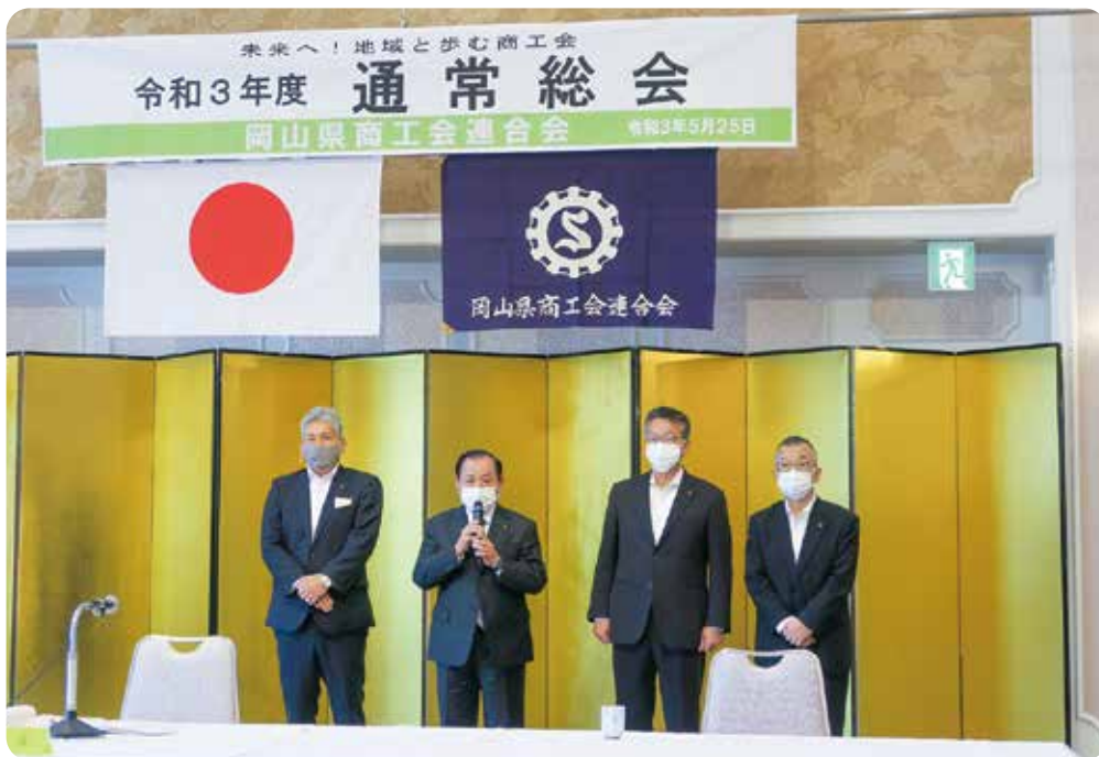
▲岡山県商工会連合会会長就任挨拶

発行所 作州津山商工会 津山市新野東567-9 TEL (0868) 36-5533 FAX (0868) 36-6396 発行日 令和3年7月20日