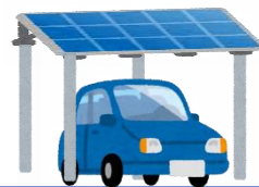
ソーラーカーポート