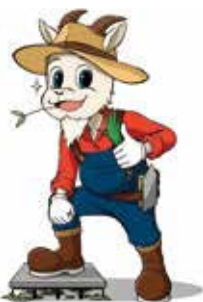
▲岡山大学と共同開発されたモルタル防草の新工法「草出ん造(くさでんぞう)」(特許出願中)イメージキャラクター

新工法の事業化により、新たに防草市場のニーズ獲得に繋がっており売上拡大に繋がっています。