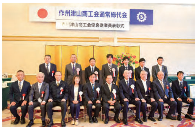
受賞者・来賓の皆様